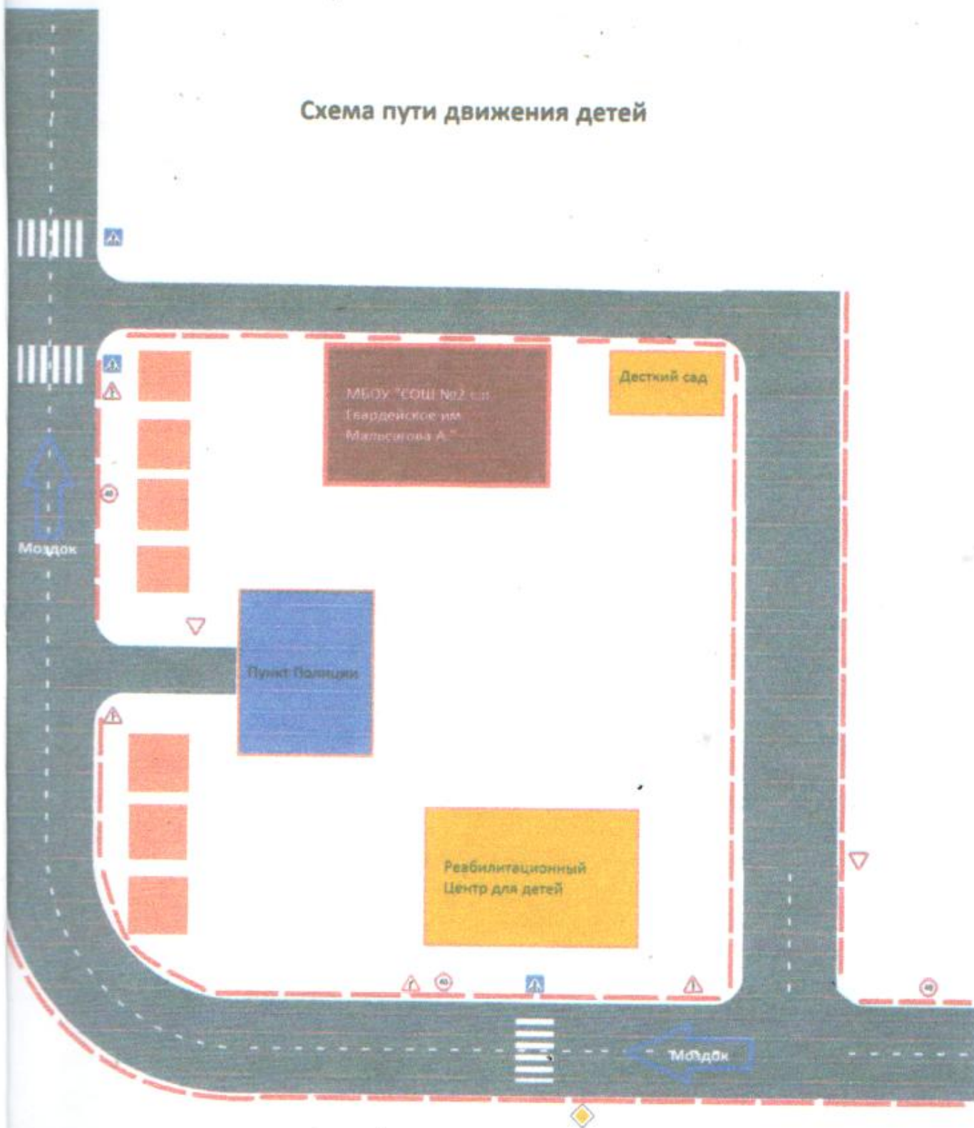
Схема пути движения детей